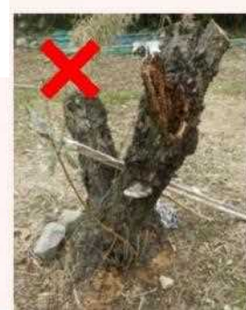
伐採した被害樹の切株 右は悪い事例、抜根できない場合は、左のように地際で切断し、シート等で被覆する。