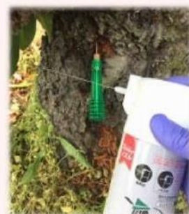
エアゾール剤の樹幹内噴射