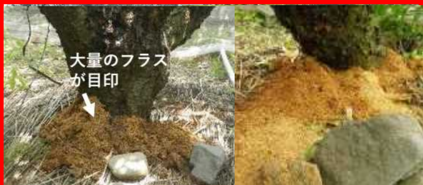
幼虫が排出したフラス

・発見日時、発見場所、発見時の状況をお知らせください。 可能であれば、写真を撮影してください。 クビアカツヤカミキリは死んでいる場合であっても見つけた場 合は連絡してください。