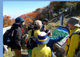
剣山をフィールドとした環境学習・山歩き講座