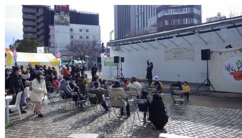
阿波地美栄×狩猟フェスタ