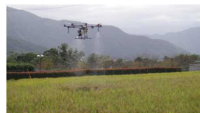
農業散布ドローン