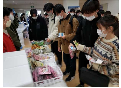
県内大学における牛乳の消費拡大