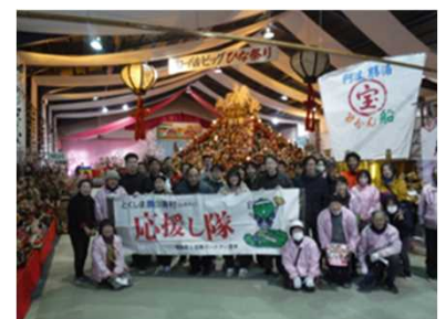
とくしま農山漁村（ふるさと）応援し隊