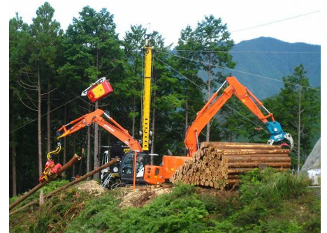
高性能林業機械の導入