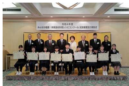
みんなが健康！ 県産食材料理レシピコンクール