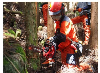
とくしま林業アカデミー