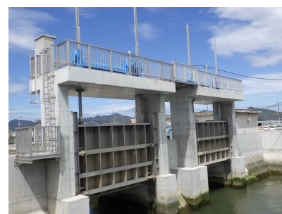
改修された排水樋門 (喜来中須入江川排水樋門)