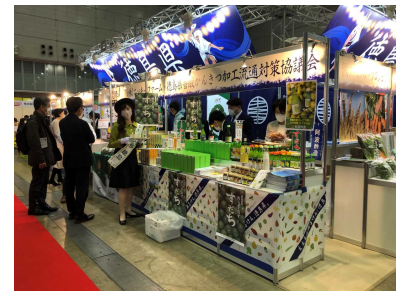
「スーパーマーケットトレードショー」