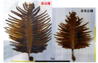
高水温耐性ワカメ品種