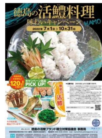
徳島の活鱧料理 味わいキャンペーン