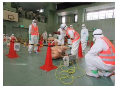
家畜伝染病防疫演習（豚熱）