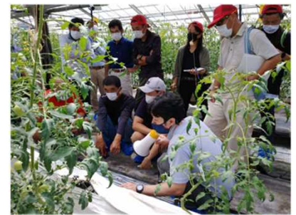
施設園芸アカデミー