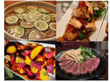
「合同メニューフェア」の料理