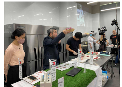
マレーシア「ハラール牛肉カッピングセミナー」