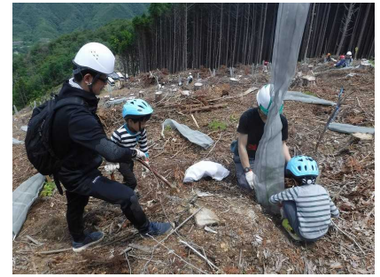
県民参加の森林づくり (獣害防護資材設置)