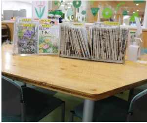
閲覧コーナー 雑誌・新聞を用意

ときわプラザ(アスティとくしま2階)には、図書室があります。小さなスペースですが、ジェンダーや女性活躍に関する本、本屋大賞、直木賞・芥川賞などの本を取り揃えており、「読みたい本がたくさんある」とのお声を頂いています。授乳室やおむつ交換ができるベビーシートや補助便座があるトイレが隣接しており、赤ちゃんや子ども連れのご家族にも便利にご利用いただけます。