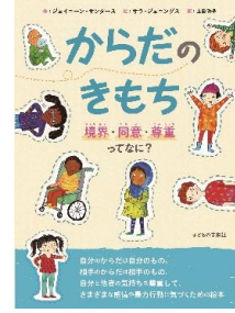
「からだのきもち」 ジェニーン・サンダース著 子どもの未来社出版