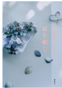
「星を編む」 凧良 ゆう著 講談社出版