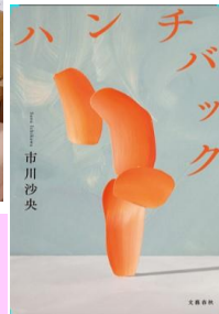
「ハンチバック」 市川 沙央著 文藝春秋社出版