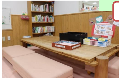
子ども遊びコーナー 座って本を読んだり、遊んだりできます。 毎月変わる手作りおもちゃが人気です。