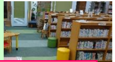
大型絵本もありますよ。