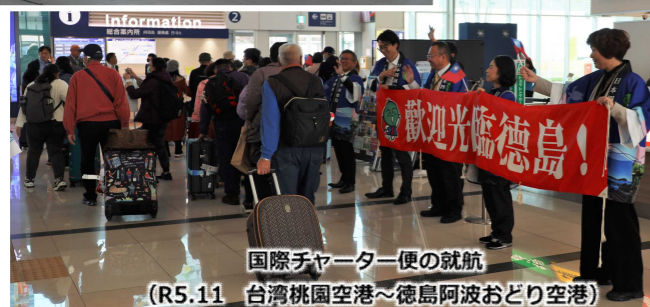
国際チャーター便の就航 (R5.11 台湾桃園空港～徳島阿波おどり空港)