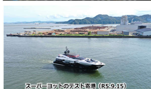
スーパーヨットのテスト寄港 (R5.9.15)