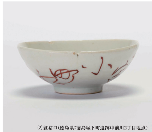
(2) 紅猪口(徳島県:徳島城下町遺跡中前川2丁目地点)