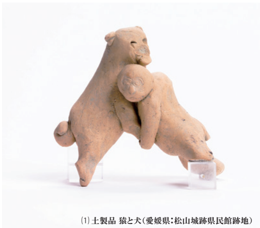
(1) 土製品 猿と犬(愛媛県:松山城跡県民館跡地)