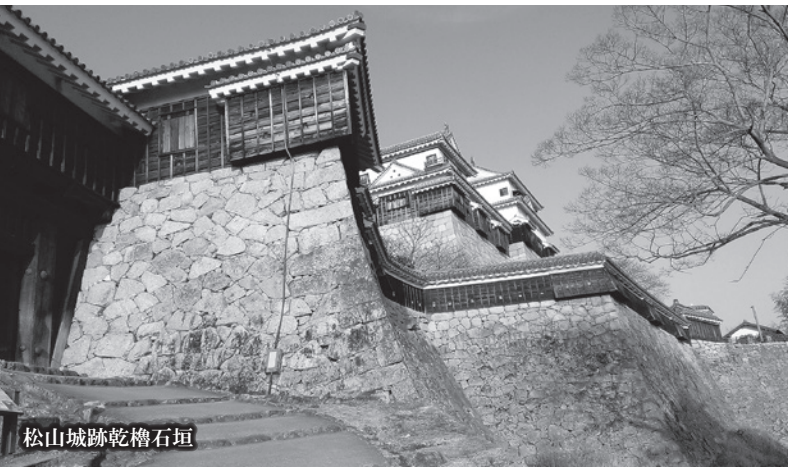
松山城跡乾櫓石垣

今年度は近世の城を取上げ、発掘調査によって明らかになってきた城、そして城下町の姿を、多彩な出土品から紹介します。四国の共通性や多様性、そしてそれらを作った、いにしえの人々の息遣いを感じていただければ幸いです。