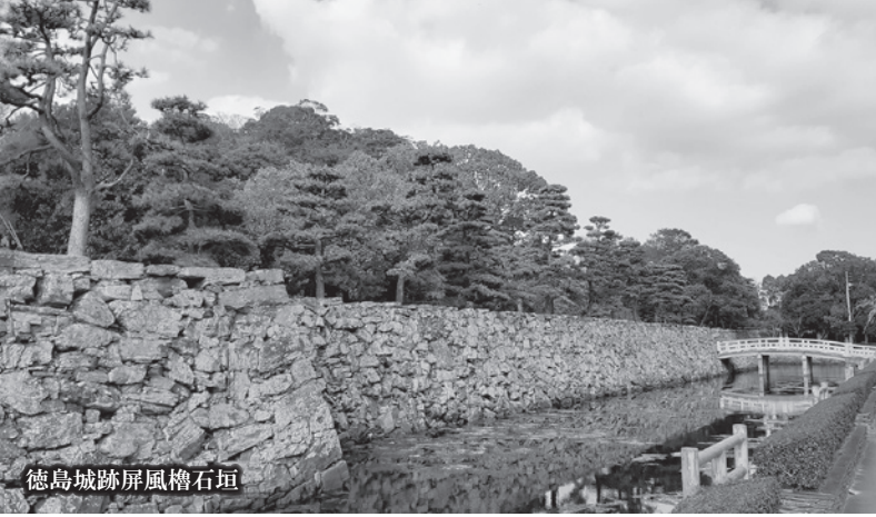
徳島城跡屏風櫓石垣

今年度は近世の城を取上げ、発掘調査によって明らかになってきた城、そして城下町の姿を、多彩な出土品から紹介します。四国の共通性や多様性、そしてそれらを作った、いにしえの人々の息遣いを感じていただければ幸いです。