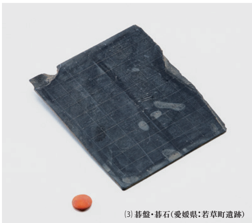
(3) 碁盤・碁石(愛媛県:若草町遺跡)