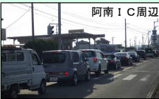
通勤時間帯の渋滞