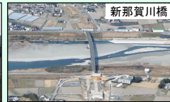
ストック効果の最大化