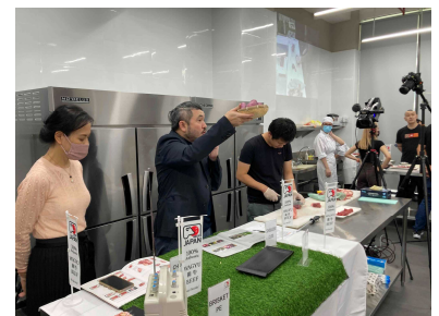
マレーシア「ハラール牛肉カッピングセミナー」