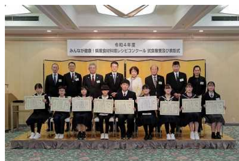
みんなが健康！ 県産食材料理レシピコンクール