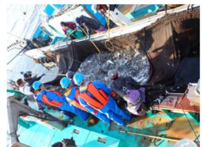
とくしま漁業アカデミー