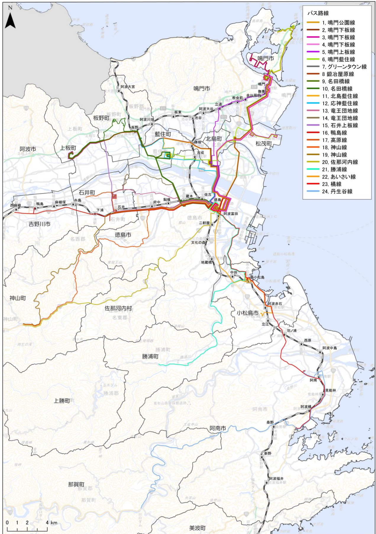
図 3.4 地域間幹線系統バス路線網(東部地域)