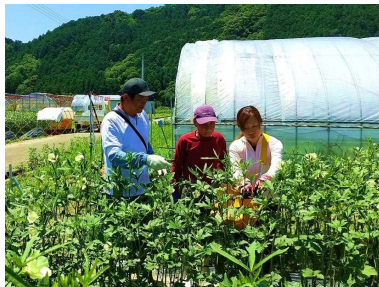
トレーニングファームの様子