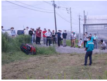
スマート農業技術研修会