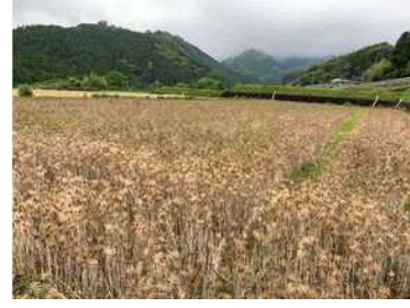
新規作物「もち麦」の導入