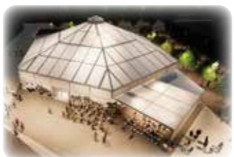
徳島パビリオンを出展する関西広域連合のパビリオン