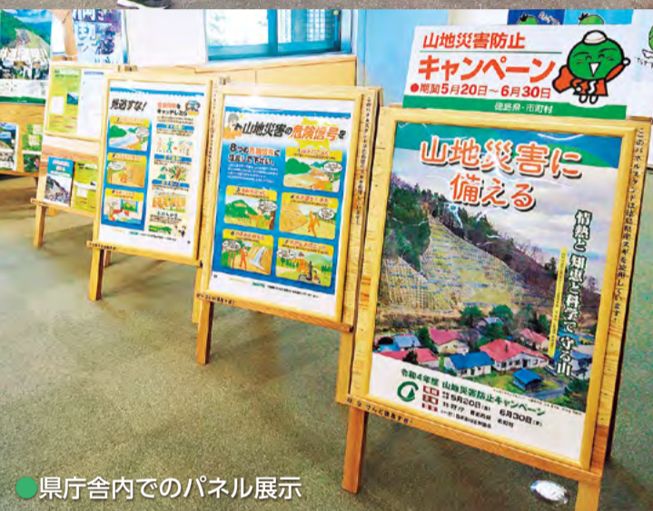
●県庁舎内でのパネル展示