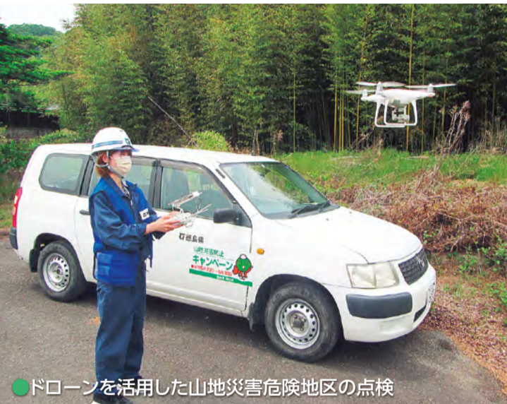
●ドローンを活用した山地災害危険地区の点検