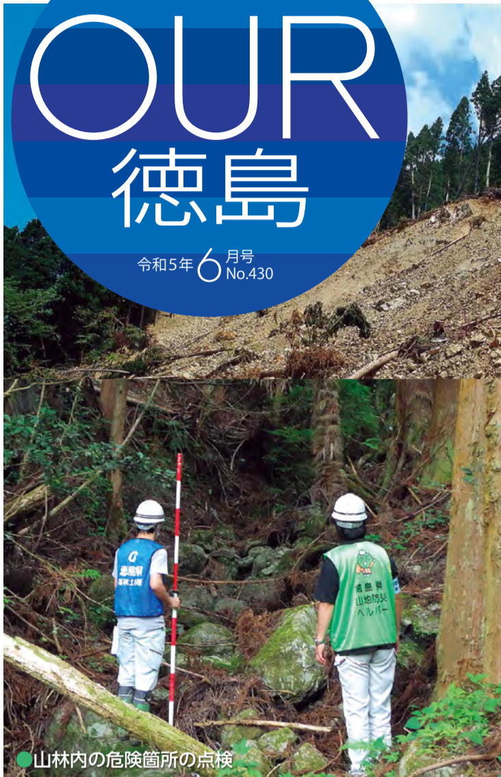
●山林内の危険箇所への点検