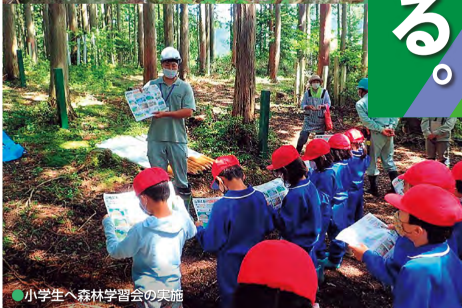
●小学生へ森林学習会の実施