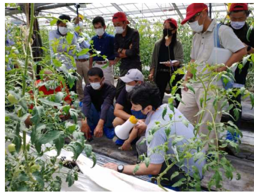
施設園芸アカデミー