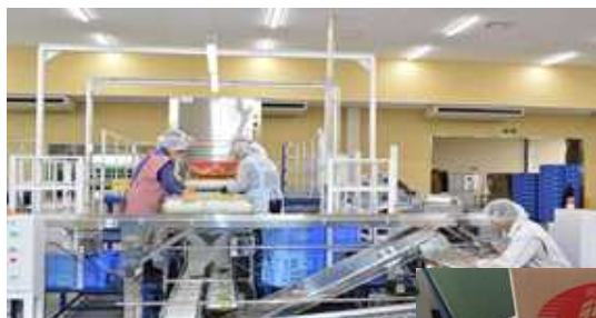
枝豆共同選別施設の整備