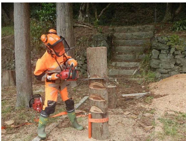
とくしま林業アカデミー