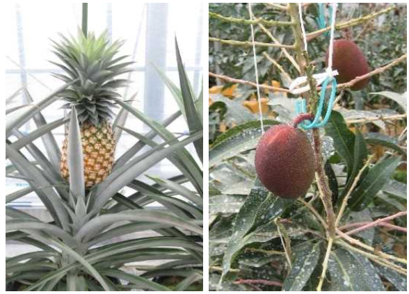
地球温暖化の効果的活用