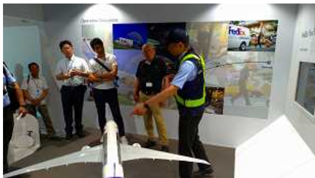
輸出に取り組む人材育成