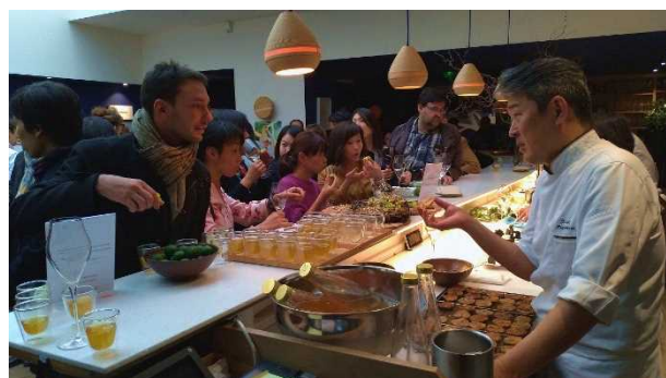
とくしま食材サロン会 inパリ