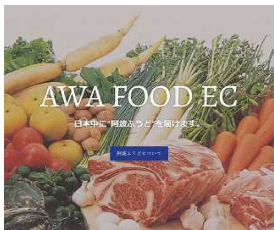
阿波ふうどECサイト