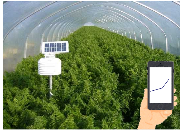
にんじん栽培施設内の環境を測定・配信するフィールドサーバー