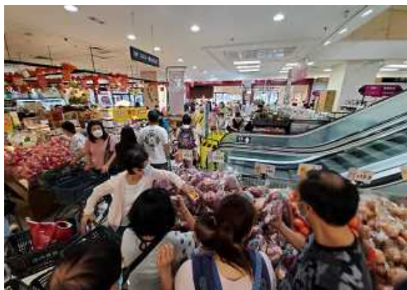
香港・なると金時フェア