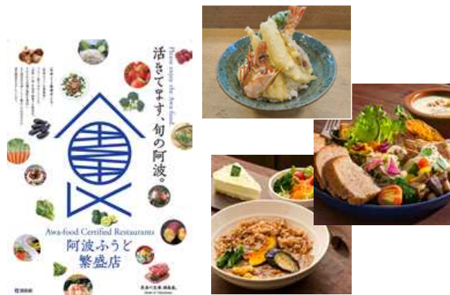
「阿波ふうど繁盛店」によるメニューフェア