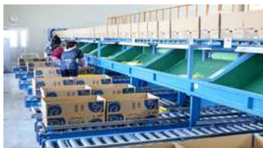
大根共同選別施設の整備