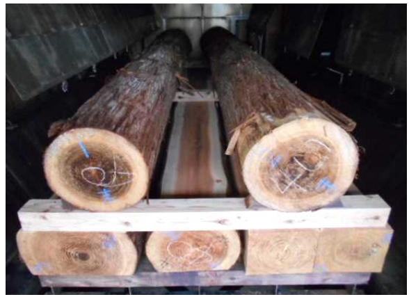
スギ大径材の需要拡大を図る技術開発