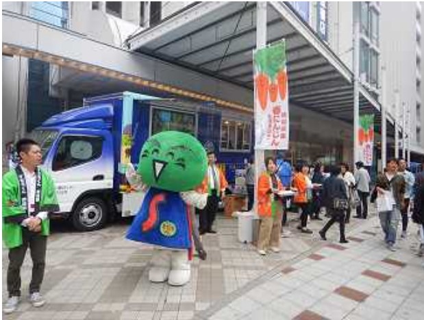
百貨店での「春にんじんフェア」