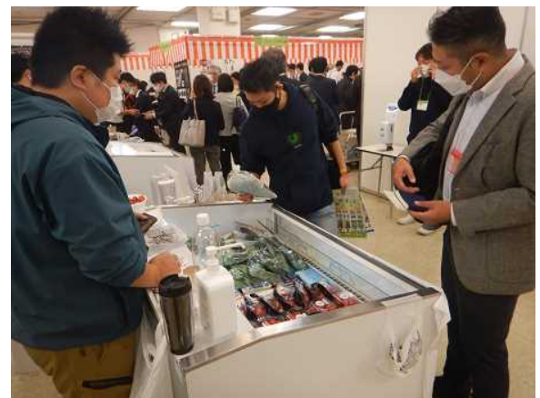
バイヤーとの商談会