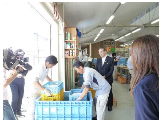
EU向けすだち検疫作業