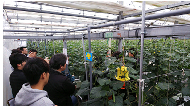
卸売市場担当者による産地ツアー