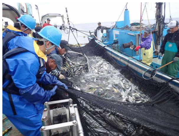
とくしま漁業アカデミー