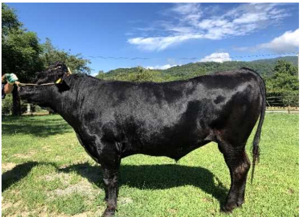
県有種雄牛の造成