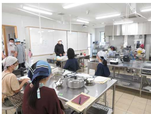
6次産業化に取り組む人材育成研修