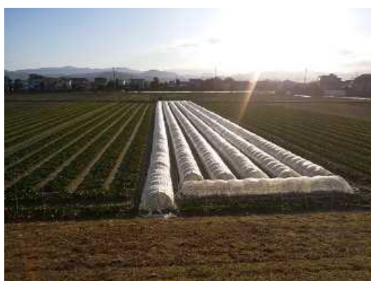
ほうれんそうの「雨よけハウス」導入