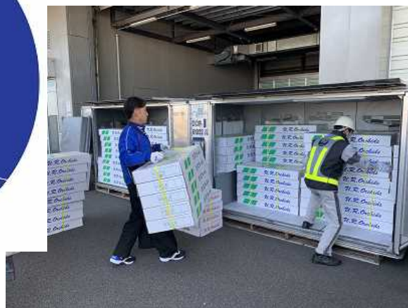
航空貨物輸送（シンビジウム）