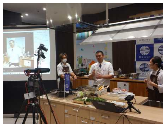
オンライン調理講習会