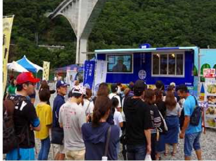
国際スポーツ大会での「とくしまエシカル農産物」のPR