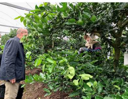
JGAP審査の様子（JAアグリあなんすだち部会）