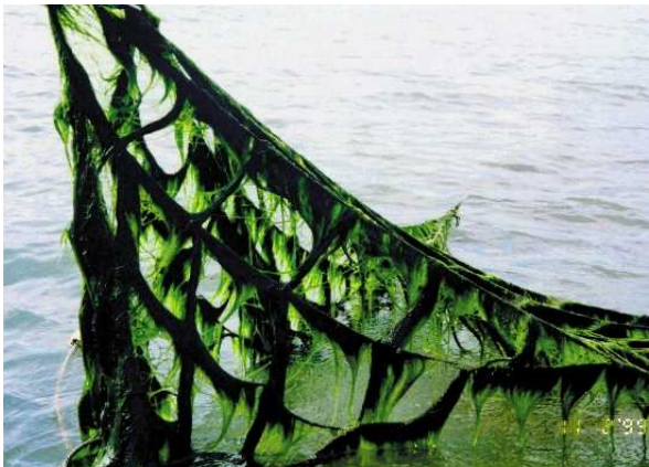
気候変動に適応する海藻の品種開発