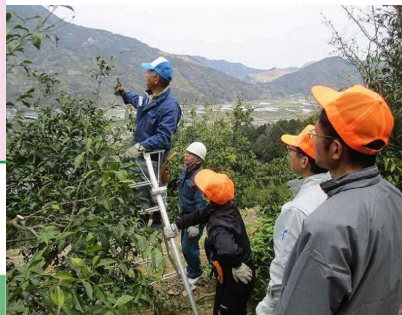
徳島かんきつアカデミー