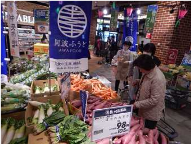
量販店での「阿波ふうどフェア」