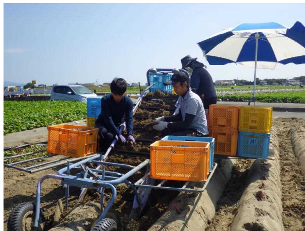
インターンシップによる 農林水産現場への受入れ