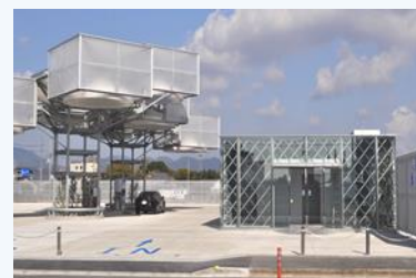
水素ステーションの稼働開始