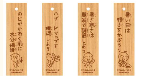
「適応策」 に関する しょうさつし や しおり