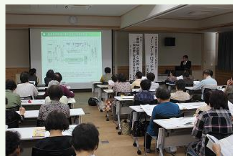
食品ロス削減セミナー