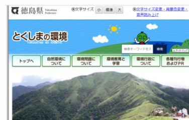
とくしまの環境ホームページ