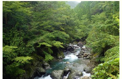
水を育む豊かな森林

ほんけん こうきょうすいいき よしのがわすいけいおよ なかがわすいけい 本県の公共用水域は、吉野川水系及び那賀川水系を ちゅうしん めぐ みずかんきょう けいせい すいさんぎょう さんぎょう 中心に、恵まれた水環境を形成し、水産業などの産業 じゅうみん こうりゅう ば ひろ りょう すいしつ や住民の交流の場としても広く利用されています。水質 おたくぶしつ のうど かんきょうきじゅん さだ 汚濁物質の濃度について、「環境基準」が定められており、 れいわ ねんど かせん ちてん かいいき ちてん けい ちてん すいしつ 令和3年度に河川77地点、海域31地点の計108地点で水質 そくてい おこな だいひょうてき すいしつしひょう かせん 測定を行いました。代表的な水質指標として河川では BOD(生物化学的酸素要求量)、海域ではCOD(化学的酸素 ようきゅうりょう せいぶつかがくてきさんそようきゅうりょう かいいき かがくてきさんそ 要求量)があり、れいわ ねんど かんきょうきじゅんたっせいじょうきょう 要求量)があり、令和3年度の環境基準達成状況は、 かせん かいいき 河川が96%、海域が100%でした。