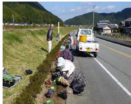
フラワーアドプト

本県では、平成12年1月にとくしま環境県民会議が設立され、環境負荷の低減に向けた取組を推進しています。令和2年度には、プラスチックごみの削減等をテーマに意見を交換しました。また、団体や企業がボランティアで地元の道路や河川、公園などの清掃活動を行うアドプト・プログラム制度が定着し、令和3年度末現在、県内で、759団体、延べ約3万4千人が参加登録し、活動を行っています。