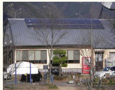
たいやうこう パネル せつしせつ 施設

とくしまけん では さいがい つよ とくせい ゆう しぜん エネルギー を かつよう し、 さまざまな 施設 への 太陽光 パネル、 LED しやうめい 照明、 リチウムイオン 蓄電池 等の せいび 整備 を かつよう すす めています。