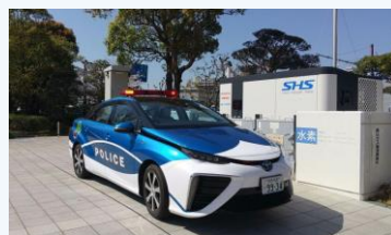
燃料電池パトカーの導入