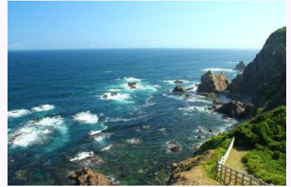
室戸阿南海岸国立公園

すぐれた自然の風景地を保護するため、本県には、瀬戸内海国立公園、剣山と室戸阿南海岸の2つの国立公園、6つの県立自然公園等が指定され、遊歩道、トイレ、展望施設等の維持管理を行いました。また、近年、不法投棄の増加や野生植物の持ち去りなどマナーの低下等が問題になっているため、県民との協働のもと、監視体制の充実・強化を図り、自然公園等の保全と適正な利用を促進しています。