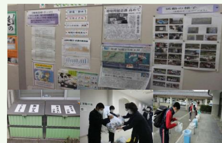
「新学校版環境ISO」活動の様子