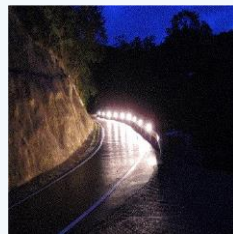
那賀町小水力(街灯)