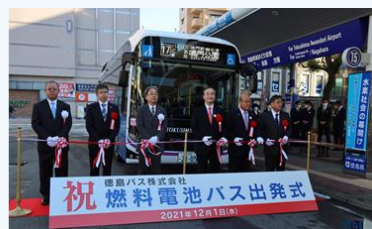
燃料電池バスの路線運行開始