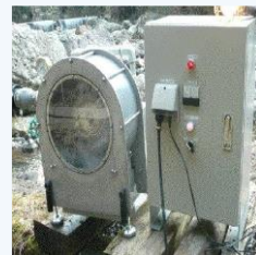
那賀町小水力(装置)