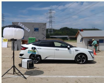
FCV による がいぶきゆうでん 外部給電

また、 けんない 各地 で 開催 される イベント で 普及 啓発 を じっし し、 「走る 発電所」と いわれる 燃料電池 自動車 (F CV) による がいぶきゆうでん の 実演 を 行う など、 さいがい つよ 「水素」 を せつきよくてき 発信 し、 県民 に 身近 な 場面 で 水素 エネルギー の 有用性 についての しょうち 周知 を 図りました。