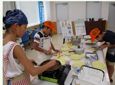
食品ロス削減啓発イベント

新たな環境問題として、プラスチックごみによる海洋汚染対策が国際的な課題となっており、本県においては、「マイバッグキャンペーン」を行うとともに、令和元年度からは「マイボトルキャンペーン」を新たに開始するなど、取組を拡充し、更なる普及啓発を図りました。