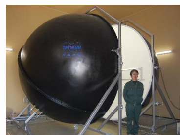
工業技術センター

ホームページや広報誌による環境情報の提供など様々な方法を用いて環境情報の提供に努めています。また、環境に関する各種の情報を取りまとめた「とくしまの環境」をホームページ上に開設し、各種の環境情報を早く、分かりやすく提供することに努めています。