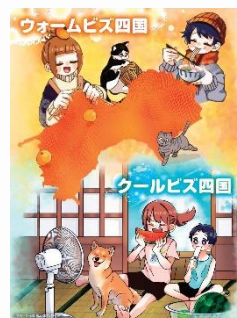
クールビズ・ウォームビズポスター

平成22年12月、複数府県により構成する全国初の広域連合として、関西広域連合が発足しました。関西広域連合では、広域的な課題などに取り組んでおり、中でも広域環境保全分野においては「温室効果ガス削減のための広域取組」、 「府県を超えた鳥獣保護管理の取組」など、様々な取組を展開しました。四国4県においても、連携して共通の課題に取り組むため、クールビズのポスター図案の募集など連携した普及・啓発活動などを推進しました。