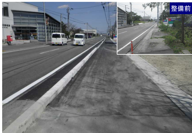
整備後 (主)鳴門池田線 庚申原工区