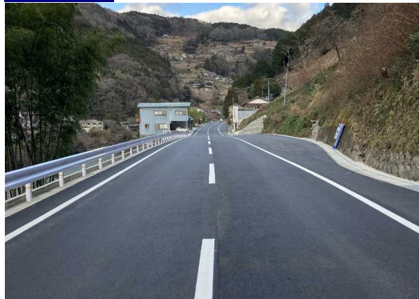
整備後 一般国道319号 八千坊工区