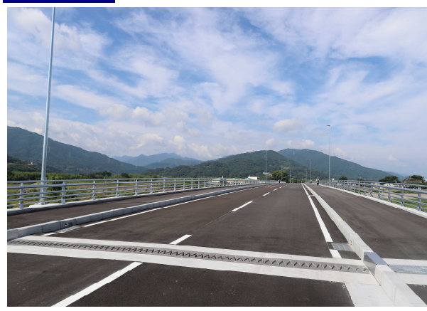
整備後 (主)鳴門池田線 共進～新町工区