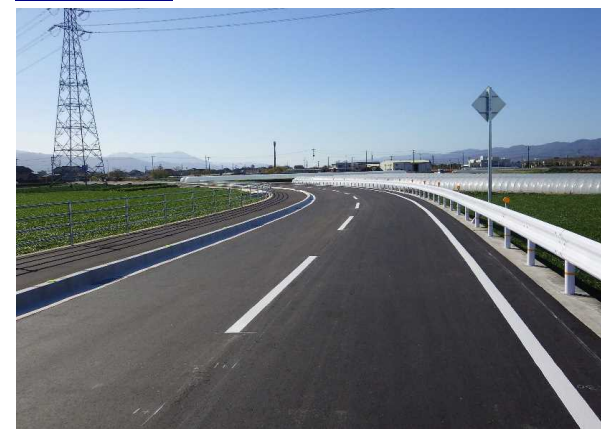
整備後 (一)西黒田中村線 西黒田工区