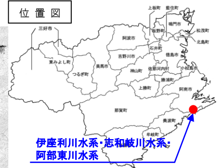
伊座利川水系・志和岐川水系・阿部東川水系