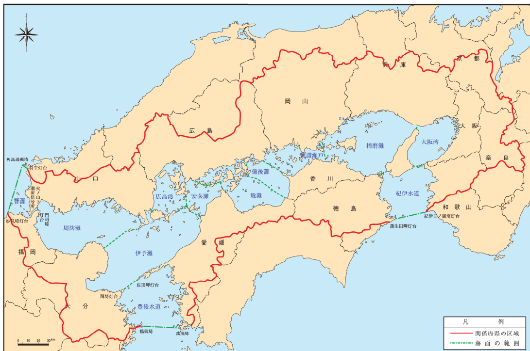
瀬戸内海環境保全特別措置法による対象区域

この計画は，「瀬戸内海の環境保全に関する徳島県計画」との一体的な取組により，里海の再生・創生を推進するものである。