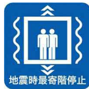
地震時管制運転装置設置済みマーク

本制度に関する詳細については、以下にお問合せください。 一般社団法人建築性能基準推進協会 電話：03-3513-7561 WEB: http://www.seinokyo.jp/