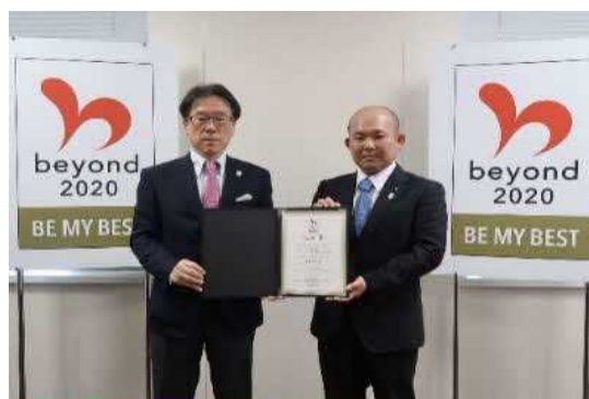
beyond2020マイベストプログラム認定