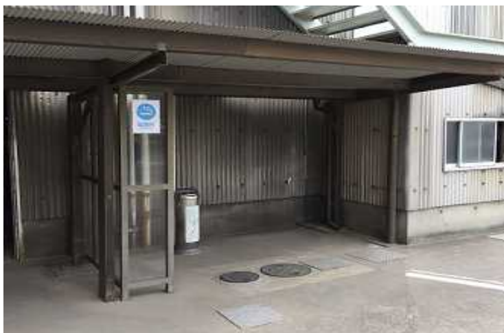
半閉鎖式の喫煙所の設置により煙の拡散防止を実施

この取組により、受動喫煙による健康被害の防止、また環境美化の推進に効果がでています。また喫煙者も減少しています。