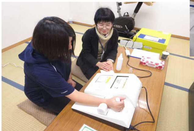
保健師による簡易骨密度検査