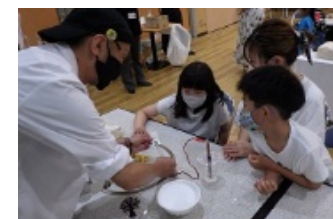
夏休みエコサイエンス教室in 東みよし町