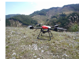
ドローンによる森林の事前調査