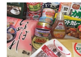
フードバンク・にし阿波