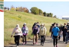
糖尿病予防フェスタ(R2)