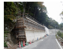
一般国道439号 落石対策工事