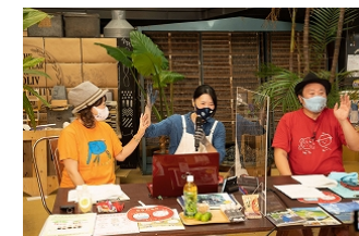
徳島「にし阿波を体感!」オンラインツアー