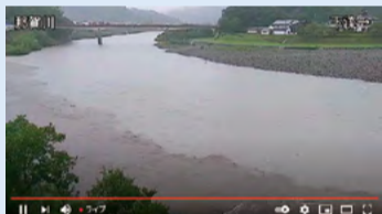
ライブ映像(那賀川)

県では、ホームページで防災情報マップや洪水予報など、災害時に役立つ情報を提供しているほか、豪雨時の「逃げ遅れ」を防ぎ、確実な避難行動につなげるため、洪水時に切迫感のある河川の状況を確認できる「河川監視カメラ」の設置を14河川18箇所で行っています。