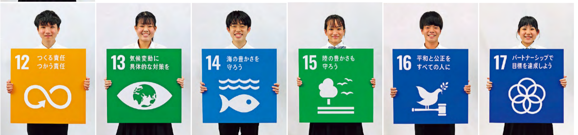
●SDGsを学び・実践する徳島県立城北高等学校の生徒たち。