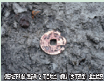
徳島城下町跡 徳島町2丁目地点 銅銭(太平通宝)出土状況