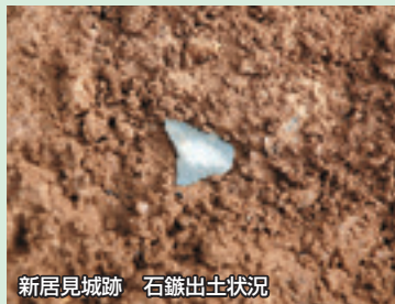
新居見城跡 石鏃出土状況