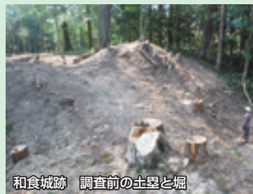
和食城跡 調査前の土塁と堀