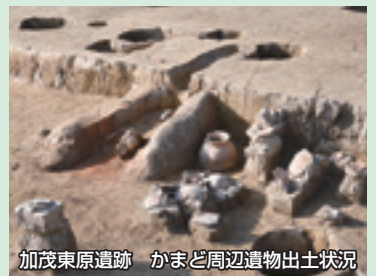
加茂東原遺跡 かまど周辺遺物出土状況

関連行事 参加無料 新型コロナウイルス感染拡大状況により、延期または中止になることがあります。HP等でご確認ください。