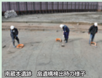
南蔵本遺跡 皇遺構検出時の様子