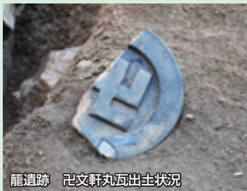
籠遺跡 瓦文軒丸瓦出土状況