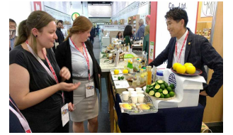
海外見本市への出展