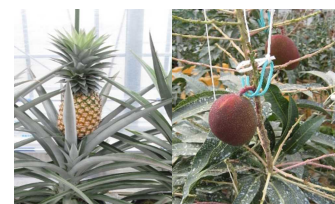
地球温暖化の効果的活用