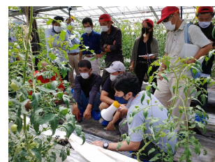
施設園芸アカデミー