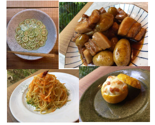
TurnTableでのメニューフェア