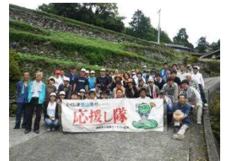
農山漁村（ふるさと）応援し隊