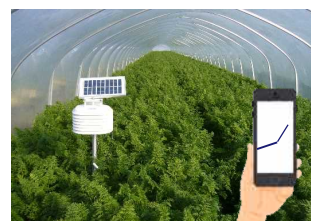
IoTを活用したニンジンの栽培管理支援システム