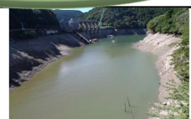
(25年7月那賀川水系渇水)