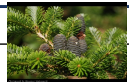
(県絶滅危惧種シコクシラベ)