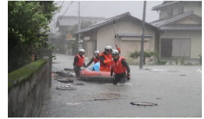
(平成26年8月豪雨(那賀町))