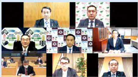
河野担当大臣らとウェブで意見交換(3月12日)

その結果、「高齢者の優先接種」について、まず、4月12日の週以降に徳島市と佐那河内村、阿南市から順次、全市町村で開始することとなりました。