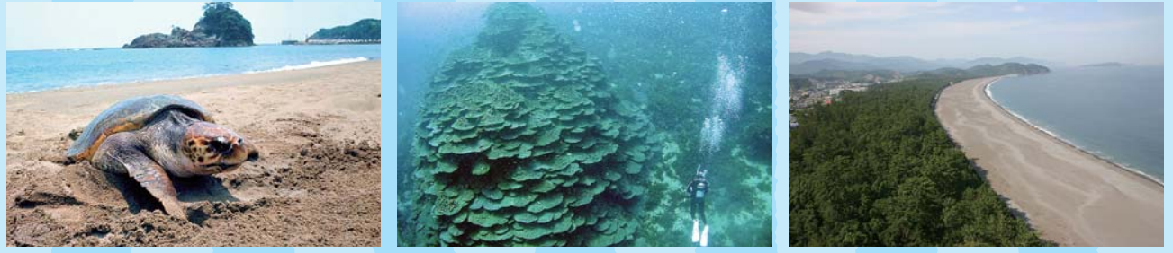
うみがめ(大浜海岸)

徳島県には魅力的で豊かな自然がたくさんあります。この自然を未来へつないでいきましょう。