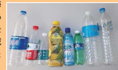
徳島に流れ着いた外国のペットボトル

海のゴミは世界の共通の問題です。外国で捨てられたゴミが徳島県の海に流れ着くこともあります。世界の海を守るためにゴミを減らす努力をしましょう。