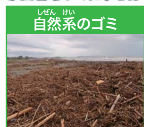
自然系のゴミ 流木や竹・枝など

町中や川、海などで捨てられたゴミなどが、最後に海岸へ流れ着いたものを海岸漂着ゴミと言います。海岸漂着ゴミには流木や枝、生き物の死がいなど自然に出た自然系のゴミと、ペットボトルやプラスチック容器などわたしたちの生活から出た人工系のゴミがあります。