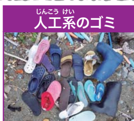
人工系のゴミ ペットボトル・サンダル・おもちゃなど