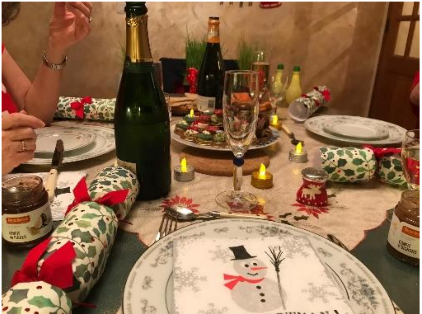
5: ローストチキンなどの料理が並ぶ、英国の伝統的なクリスマス・ディナーの食卓

このように、英国では消費者の行動に大きな変化が起こりつつありますが、あるアンケート調査では、英国の買い物客の80%以上が、買い物の習慣が良い方向に変わったと回答しています。これらの変化が一過性のものでないということは、英国内の多くの事業者にとって、新しい消費のあり方に適応していく必要を迫るものであると言えるでしょう。