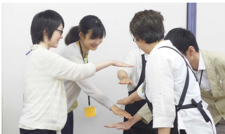
「笑顔トレーニング」の様子。毎朝の朝礼や研修の際に行い、笑顔になる環境を構築している（この写真は2018年6月実施したものです）

当社に出来ることを行いながら、笑顔のあふれる明るい社会を創るため、全社員一丸となり日々努力しています。