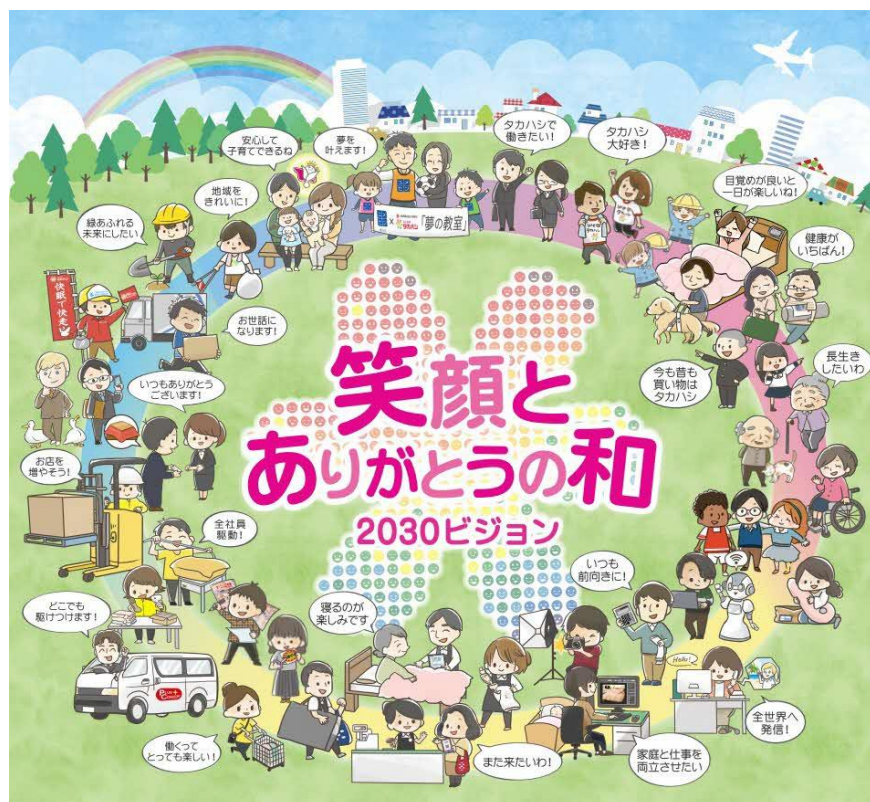
ふとんのタカハシの未来像が見える化した2030年ビジョン