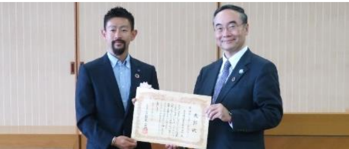
第2回とくしまエシカルアワード表彰式