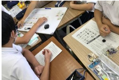
中学生向け教材活用の様子