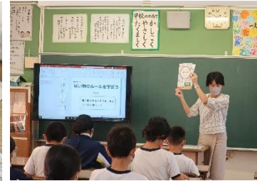
小学生向け教材活用の様子