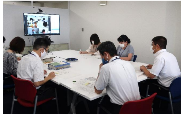
徳島県・徳島県警・市町村見守りネットワーク 合同WEB会議開催

市町村の連携の強化を図り、引き続き県内各ネットワークにおける実効性のある取組を推進 全国市町村での協議会設置の普及と見守り活動の推進に貢献