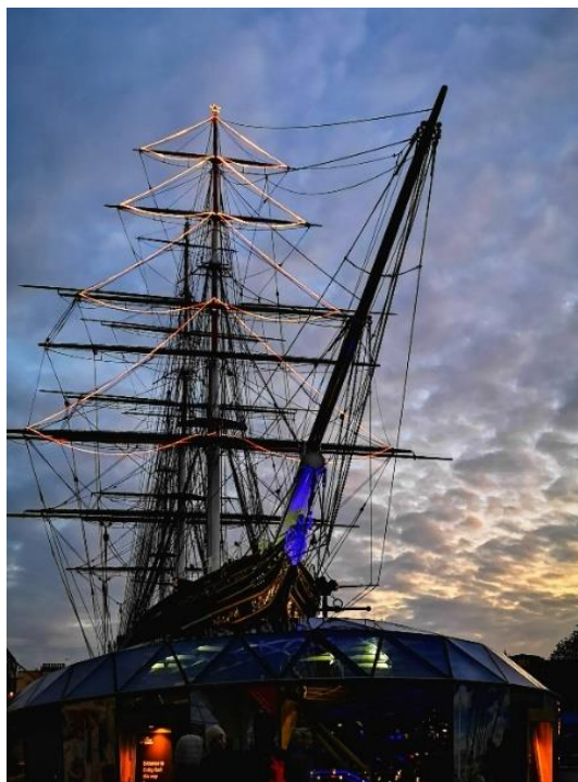
2: グリニッジに展示されている19世紀の帆船「カティーサーク号」も、マストにもみの木のイルミネーションを飾り、クリスマスムードを演出しています。