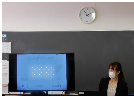
特別支援学校向け消費者教育教材試用授業