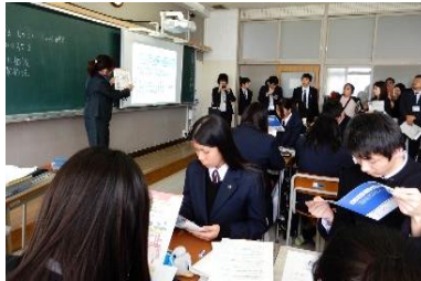
「社会への扉」活用の様子