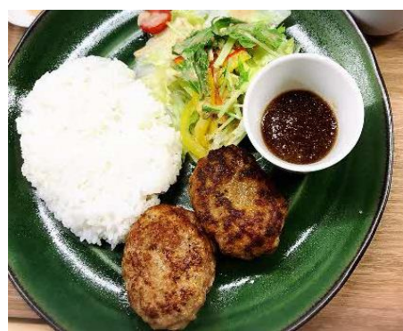
れんこんバーグ（れんこんパウダー入り）