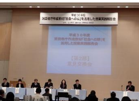
「社会への扉」授業実践報告会