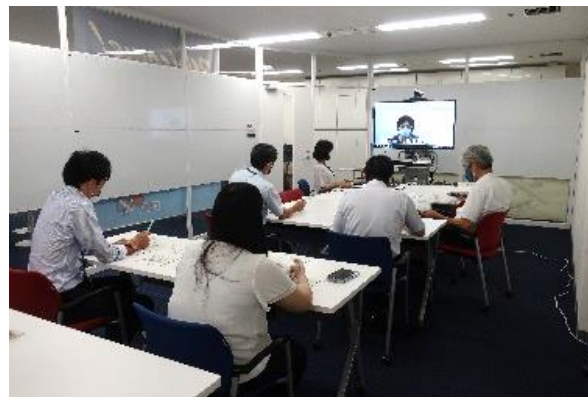
消費者庁、四国、関西とのWeb会議 (R2.8)

消費者志向経営に取り組む事業者の拡大を目指し、徳島県内はもとより、四国や関西にも 連携を広げ、消費者市民社会の実現やSDGsの目標達成に貢献