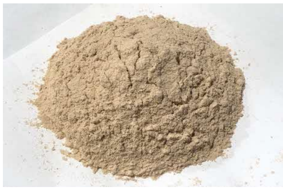
れんこんパウダー

これからも「もったいない精神」を忘れず、エシカル消費を知ってもらうべく推進していきます。