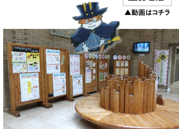
子どもの事故防止パネル展示 （R2.7.20～7.31）

県内での調査結果を踏まえた有効施策を全国展開 研修会や啓発活動を通じて多分野から子どもの事故を防止