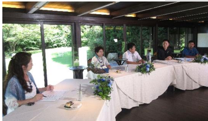
エシカル消費座談会 映像