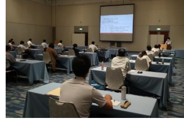
市町村公益通報担当者研修会 (R2.8.4)

徳島県内市町村共通の窓口の整備の効果と、中小企業における内部通報制度の導入及び円滑な運用推進の効果を検証した上で全国展開