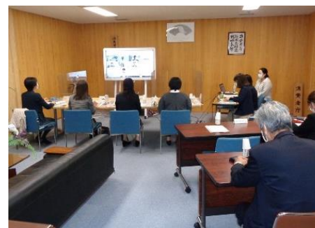
デジタル教材開発に向けた有識者会議

若年者が、変化する消費生活に対応し、消費者市民社会の形成に参画できる 自立した消費者の育成のために、実践的な消費者教育の充実を図る