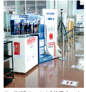
サーモグラフィーによる体温チェック

徳島の経済を支える空の玄関として、徳島阿波おどり空港を安心してご利用いただけるよう、私たち従業員も