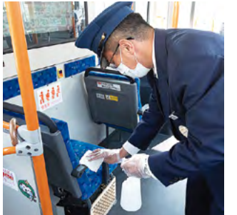
運行後の車内消毒を徹底

います。通学や通院などに欠かせない生活交通としての責任を果たすために、今後も従業員の感染予防を徹底してまいります。これからも安心してご利用ください。