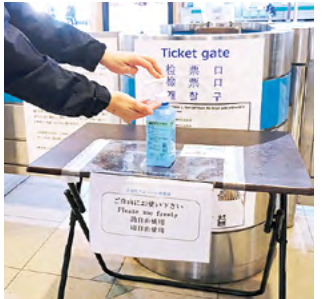
改札に消毒液を設置

売機、では、指定席の場所をご自身で選んでいただくことも可能です。皆さんの日常を守り続けるため、社員一同、一層の感染予防策に取り組んでいきます。