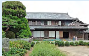
藍染め体験ができる「藍の館」

藍染めとは、藍を染料とした染物のことです。藍は今から約1,500年前に中国から伝えられ、人類最古の染料とも呼ばれています。布や衣服を染めるときには、輪ゴムや割り箸などを使って模様をつけることができます。その仕上がり具合といたら、言葉では言い表せないほどの美しさなのです。さらに、藍にはさまざまな効用があるといわれ、肌荒れや冷え性を防いだり、衣服や和紙の虫よけとなったりしています。美しい上に肌荒れを防いでくれるのです。素晴らしい伝統工芸だと思いませんか?