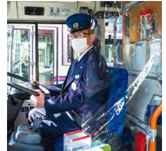
運転席の飛沫感染防止スクリーン

お客様との接点が多い、運転手の感染予防策にも力を注いでいます。始業点呼時に体温測定を実施していることはもちろん、バスの最前列の席の使用を控えていただき、運転席と通路の間には透明の飛沫感染防止スクリーンを設置して、お客様との適切な距離を保つよう心掛けて