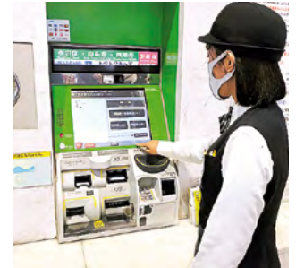
自動券売機で接触機会を低減

密集対策では、混雑緩和策として一部列車の車両を増やしているほか、お客様へのテレワークや時差出勤を呼びかけています。混雑状況の情報をホームページでも随時、提供させていただいておりますので、ぜひご利用ください。また、ネット予約や駅に設置している「みどりの券