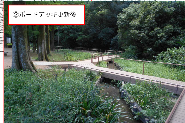
②ボードデッキ更新後