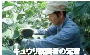
キュウリ就農者の定着