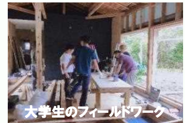
大学生のフィールドワーク