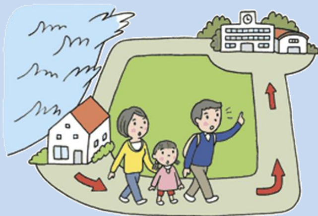
危険を感じたら早めの避難