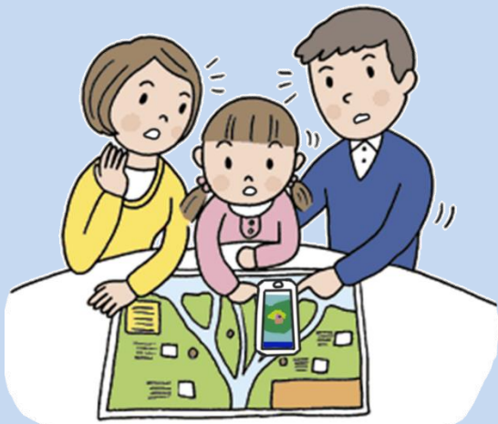
気象や警報に関する情報の収集

河川の洪水・氾濫が心配されるような大雨が続く場合、河川の水位情報、注意報・警報や洪水予報等を常に収集し、早めの避難を心がけることが大切です。