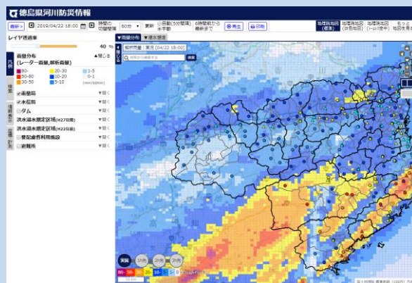
雨の降り方を地図で確認