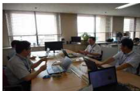
【担当内ミーティングの様子】