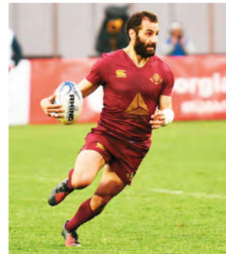
Merab Kvirikashvili メラブ・クヴィリカシヴィリ