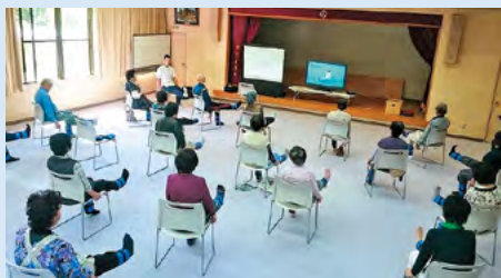
「いきいき百歳体操」でいつまでも健やかに！

徳島県で65歳以上の方は、約24万1千人、ちょうど県民の3人に1人の割合となり、高齢化率は長寿大国・日本の中でもトップクラス。中でも100歳以上の方は、約540名と、本県は「人生100年時代」を先取りする「長寿先進県」です。