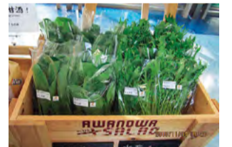
障がい者 就労支援施設で 生産した 農作物の販売