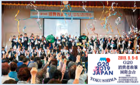
消費者行政・消費者教育の取り組みを 徳島から発信して参ります。

開催地である本県からは、日本を代表す る消費者行政・教育の取り組みや、エシカル 消費をはじめ、県民の皆さんの実践活動、さ らに食や観光はじめ徳島が世界に誇る多 様な魅力の発信を行って参ります。