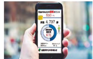
スマホアプリで 「楽しく!」 「お得に!」 健康づくり