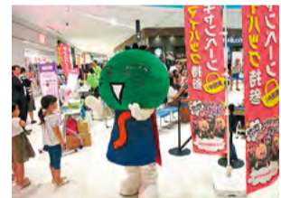
スーパー店頭での マイバッグ キャンペーン

● お問い合わせ先 / 財政課 ☎088-621-2052 FAX088-621-2827