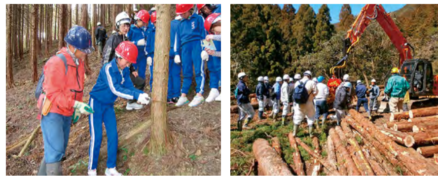
次代を担う子どもたちを対象とした間伐体験教室。 高性能林業機械を使った林業技術研修の様子。

県産材の効率的な生産体制を担う林業就業者の確保と育成に重点を置き、現場での即戦力を養成する「とくしま林業アカデミー」を平成28年4月に開講。これまでに3期37名(うち女性2名)を県内林業事業体へ送り出しています。