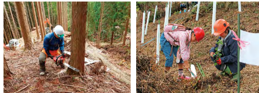
林業従事者による間伐作業で、森林の適正な管理がなされています。 「豊かな森林になあれ」と願って、植樹作業をしています。

徳島の豊かな森林を次世代に引き継ぐため、「林業従事者による森林づくり活動」や全国一の参加企業・団体数を誇る「とくしま協働の森づくり事業」などを実施。経営が継続できない森林で、幅広いボランティア参加による森林づくり活動を県内各地で行っています。