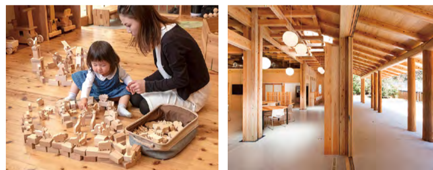
「徳島すぎ」のおもちゃで、親子でスキップ! 「徳島すぎ」をふんだんに使った徳島県木材利用創造センターの林業人材育成棟。

県産材の利用拡大に向け製品開発やブランド化を促進中。県内各地に「すぎの子木育広場」を20カ所開設して、木育を進めているほか、平成31年2月には「木育サミットin徳島」を開催するなど木づかい運動を進めています。