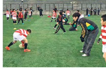
●ラグビーの普及にも熱心に取り組んでいます。

今年9月には、アジア初となる「ラグビーワールドカップ2019」が日本で開催されます。同大会に5大会連続で出場しているジョージア代表が鳴門市で事前チームキャンプを行うことが決まっています。