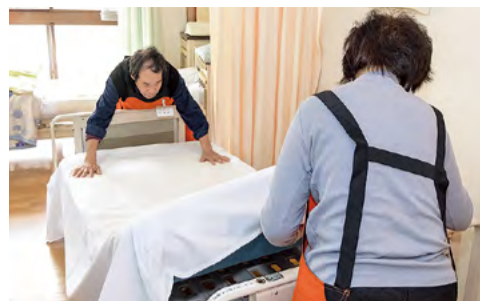
●シーツ交換や部屋の掃除など介護の現場をサポート。

2019シーズン ホーム開幕戦 3/3(日) 14:00~ FC岐阜 鳴門・大塚スポーツパーク ポカリスエットスタジアム