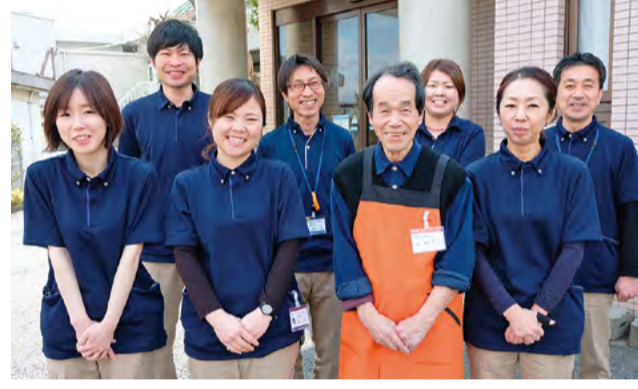
●若いスタッフに囲まれながら、いきいきと仕事に取り組んでいます。

年に約1400人の介護人材が不足する見込みとなっています。こうした中、県では、介護現場での仕事の切り分けを進め、元気なシニアに周辺業務を担ってもらう「介護助手」のモデル事業を開始。介護現場の負担軽減を図るとともに、シニアがいそいそと活躍できる場を創出しています。