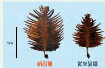
海水温の上昇に対応した収量性の高いワカメの新品種

8月末から収穫可能で夏台風の被害を回避できるレンコンの新品種「阿波白秀(あわはくしゅう)」