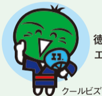
徳島夏・冬の エコスタイル

■温室効果ガスを「2030年度に40%削減(2013年度比)」を目標に、県民の皆さんに、省エネルギーにつながる脱炭素型ライフ・ビジネススタイルへの転換を促進しています。