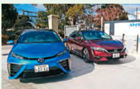
水素ステーションとFCV(燃料電池自動車)

■究極のクリーンエネルギー「水素」や、太陽光など、自然エネルギーの導入に最大限取り組んでいます。