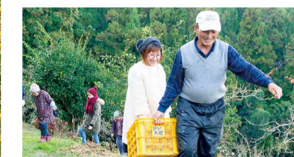
●傾斜地農業体験には多くの方が訪れます。

昨年7月、素朴な里山の風景が広がる美馬市穴吹町洞名地区に、農家レストラン「風和里が