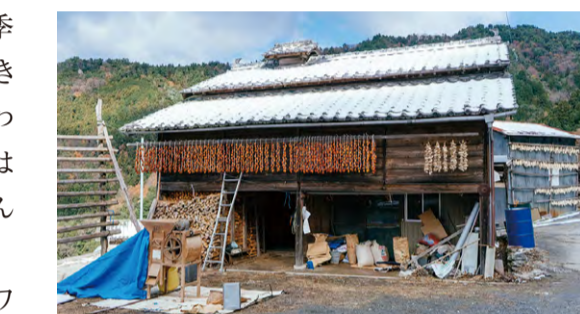
●納屋には収穫された作物が保存されています。

式典にも招かれるなど、ご夫婦にとっても思い出深い年になりました。「教育旅行で訪れた子どもたちが、この料理や風景に笑顔になってくれるんよ」とご夫婦。傾斜地農業の伝統を、さらなる未来へとつなげています。