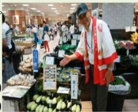
首都圏での常時販売