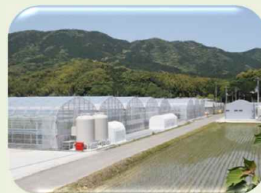
次世代園芸ハウス