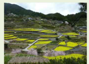
共同活動により保全された棚田