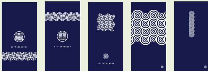
ロゴマークと「組藍海波紋（くみあいがいはもん）」の組み合わせ例