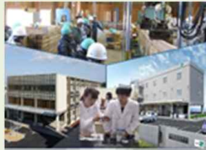
サイエンスゾーン