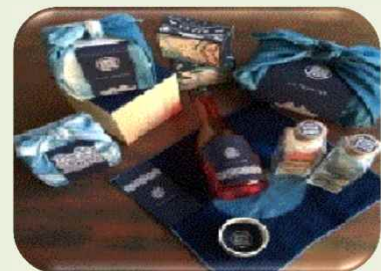
食藍商品(イメージ)