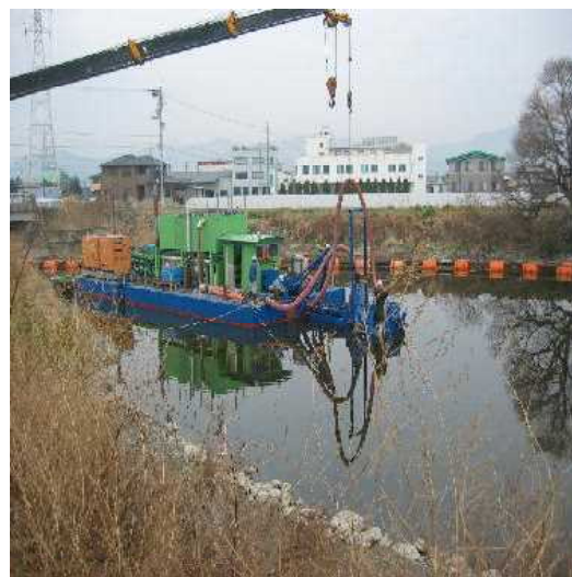
正法寺川の浚渫状況