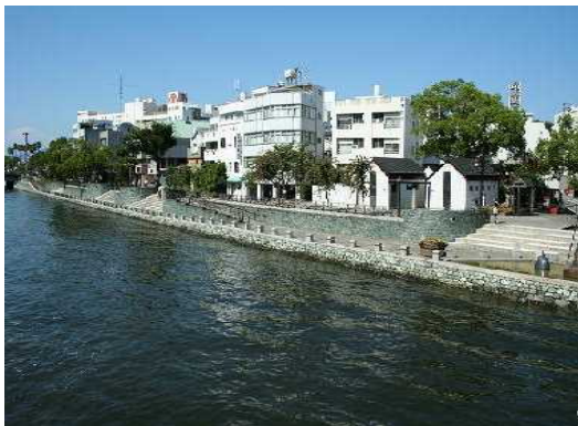
新町川の修景護岸