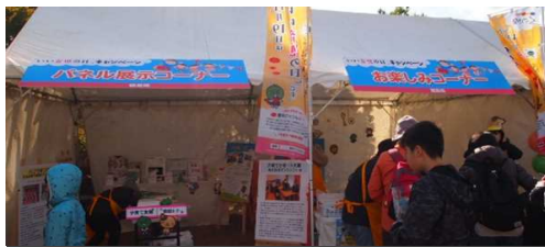
あさんワーキングフェスタでの啓発活動