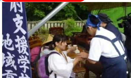
特別支援学校 「みんなが主役」きらめき事業