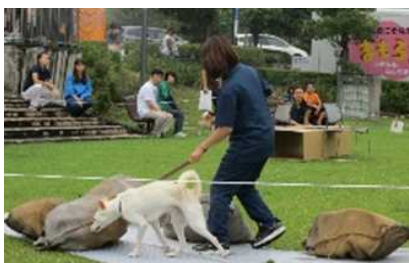
災害救助犬等 育成プロジェクト推進事業