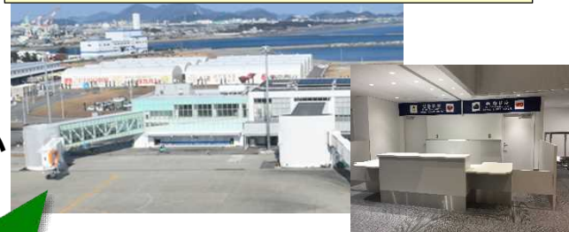
徳島阿波おどり空港・新ターミナル