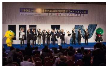
知事同盟サミット in とくしま