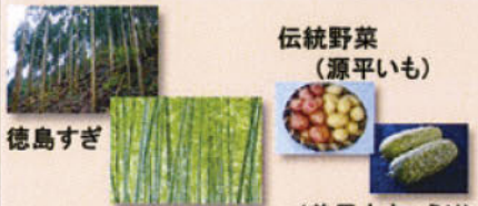
徳島すぎ 伝統野菜 (源平いも) 竹林 (美馬太きゅうり)