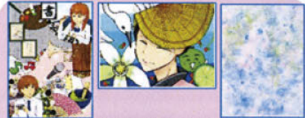
特別支援学校生徒の デジタルアートと絵画