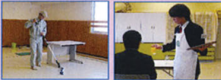
技能検定に取り組む生徒たち