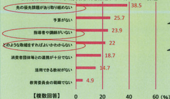
教育委員会における消費者教育を推進するにあたっての課題

平成25年度消費者教育に関する取組状況調査のフォローアップ調査をもとに作成【文部科学省】