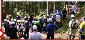
H27.10.13 「海部きゆうり塾」開講