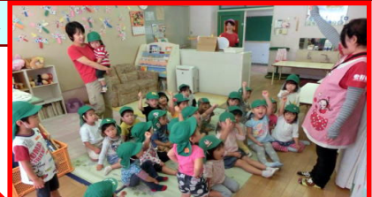
<H27.6月補正> 阿波っ子はぐくみ保育料助成事業