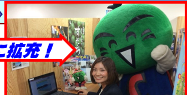
H27.12.1「住んでみんで徳島で！ 移住交流センター」オープン！