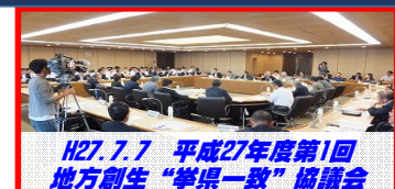
H27. 7. 7 平成27年度第1回 地方創生“拳県一致”協議会

H28.2.4 「総合戦略」の推進に係る金融機関 (阿波銀行、徳島銀行)との連携協定締結式