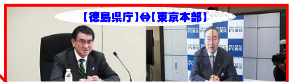
H27.12.14 飯泉知事が河野大臣（消費者）とテレビ会議で会談！