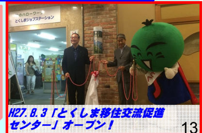
H27. 8. 3 「とくしま移住交流促進センター」オープン!