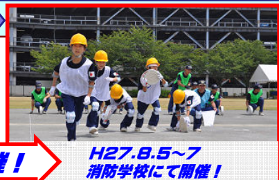
H27.8.5~7 消防学校にて開催！