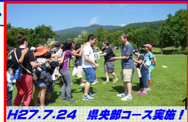
H27.7.24 県央部コース実施！