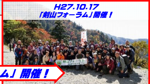
H27.10.17 「剣山フォーラム」開催！