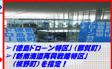
➢「徳島ドローン特区」(那賀町) ➢「新南北海道再興戦略特区」 (板野町)を指定！