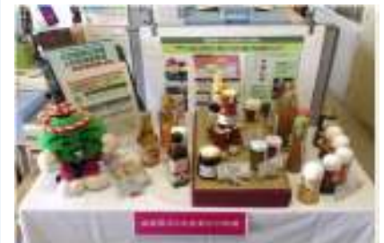
6次産業化ビジネスモデルの構築