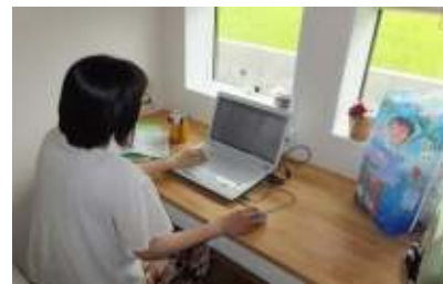
テレワーク導入による新たな働き方 「徳島モデル」を創出