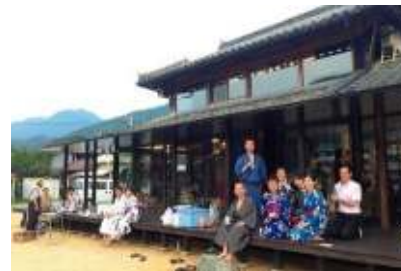
サテライトオフィスのさらなる展開