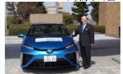
「未来エネルギー」への挑戦