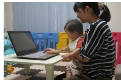
テレワーク導入による新たな働き方 「徳島モデル」を創出