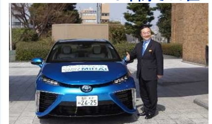
「未来エネルギー」への挑戦