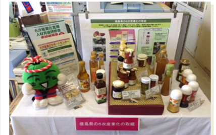
6次産業化ビジネスモデルの構築