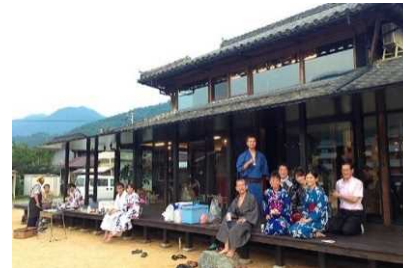
サテライトオフィスのさらなる展開