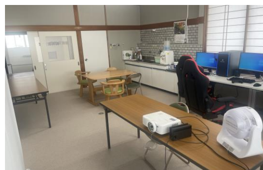
【キッチン・食事スペース】