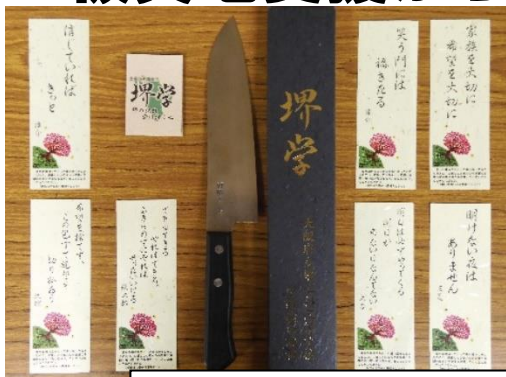
授業で製作した地場産業の「包丁」