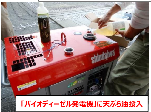
「バイオディーゼル発電機」に天ぷら油投入