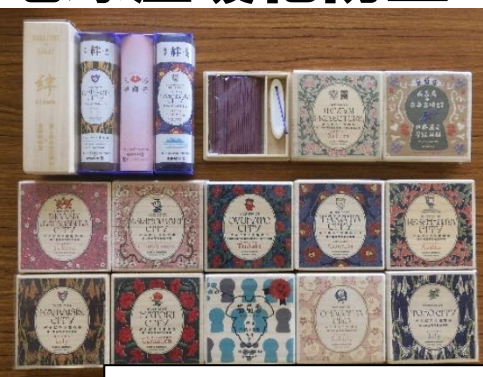
授業で製作した地場産業の「線香」