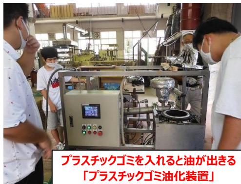
プラスチックゴミを入れると油が出る 「プラスチックゴミ油化装置」