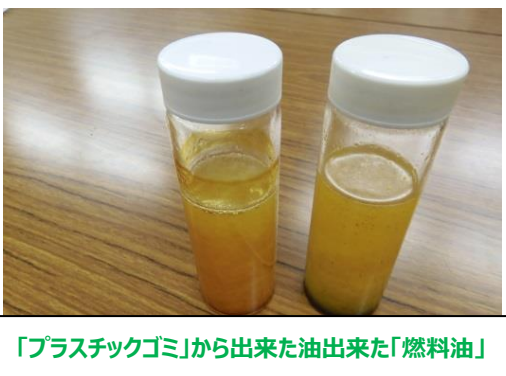
「プラスチックゴミ」から出来た油出来た「燃料油」