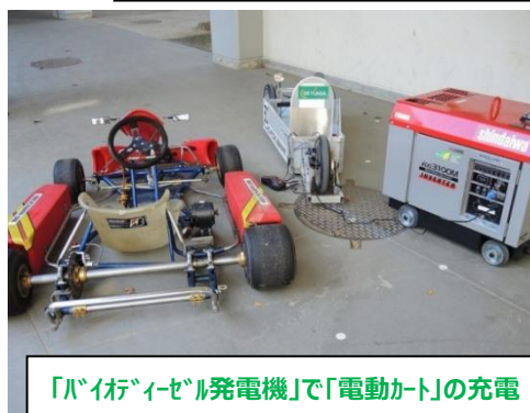
「バイオディーゼル発電機」で「電動カート」の充電