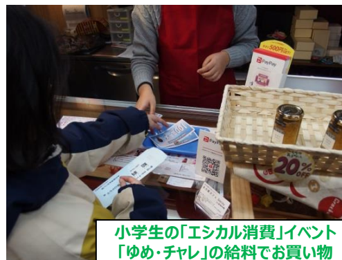
小学生の「エシカル消費」イベント 「ゆめ・チャレ」の給料でお買い物