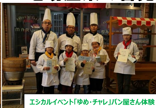
エシカルイベント「ゆめ・チャレ」パン屋さん体験