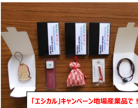
「エシカル」キャンペーン地場産品で！