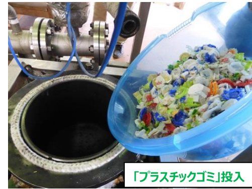
「プラスチックゴミ」投入