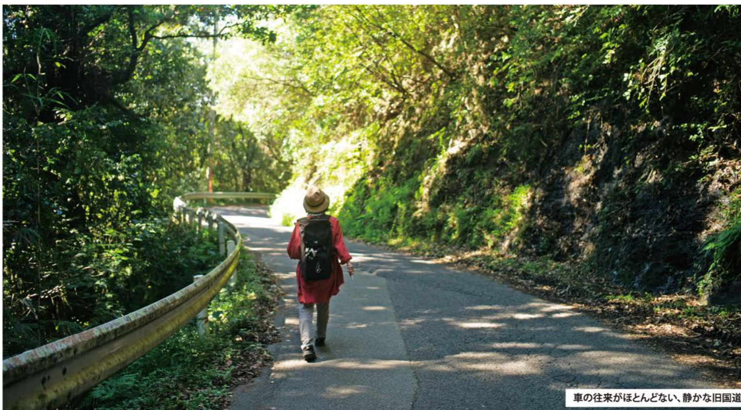
車の往来がほとんどない、静かな旧国道