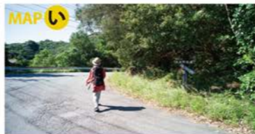
静かな旧国道を南へ進む