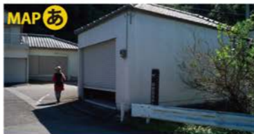
国道55号を左折して脇道に入る