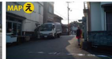
三叉路を右折し町中を進む