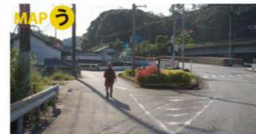
脇道に入り、その先の橋を渡る